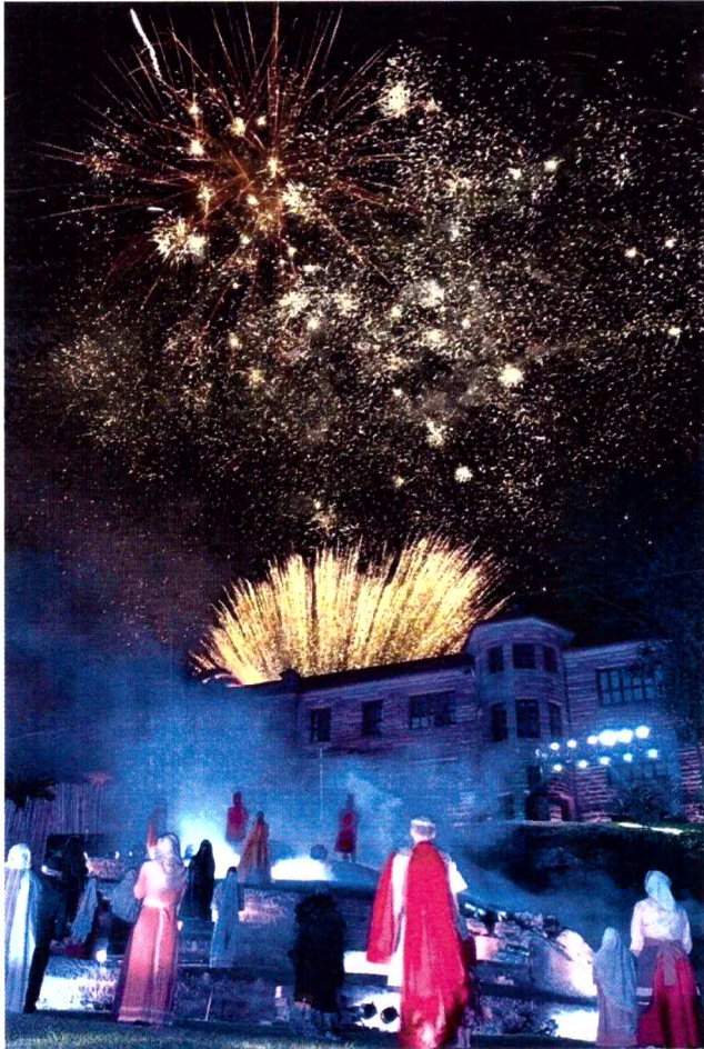
PAIXÃO DE CRISTO EM IMIGRANTE