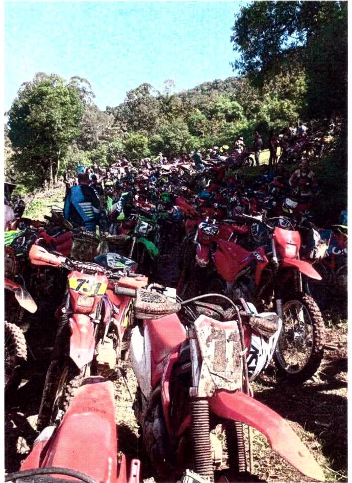
5º TRILHA DO COELHO