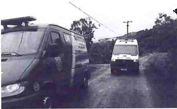
Atendimento a queda de motociclista