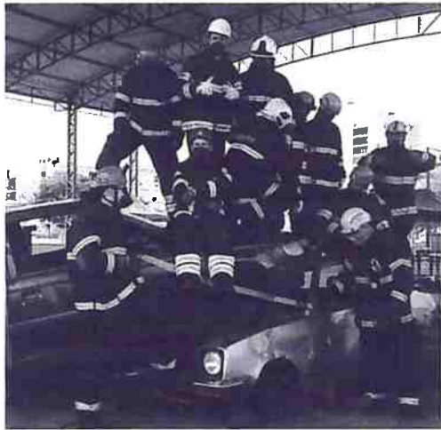
Treinamento salvamento veicular