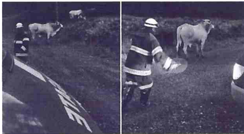
Atendimento a ocorrência de animais em via pública