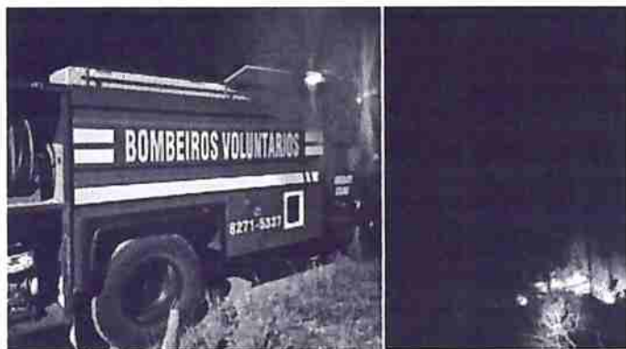
Combate a fogo em vegetação